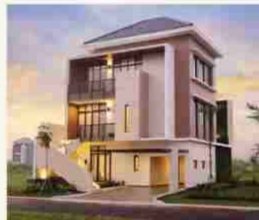
LUXURY SHOW UNIT KABA 10X17