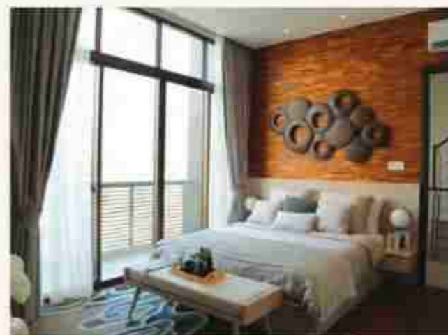
LUXURY SHOW UNIT HINOKI 9X14.5