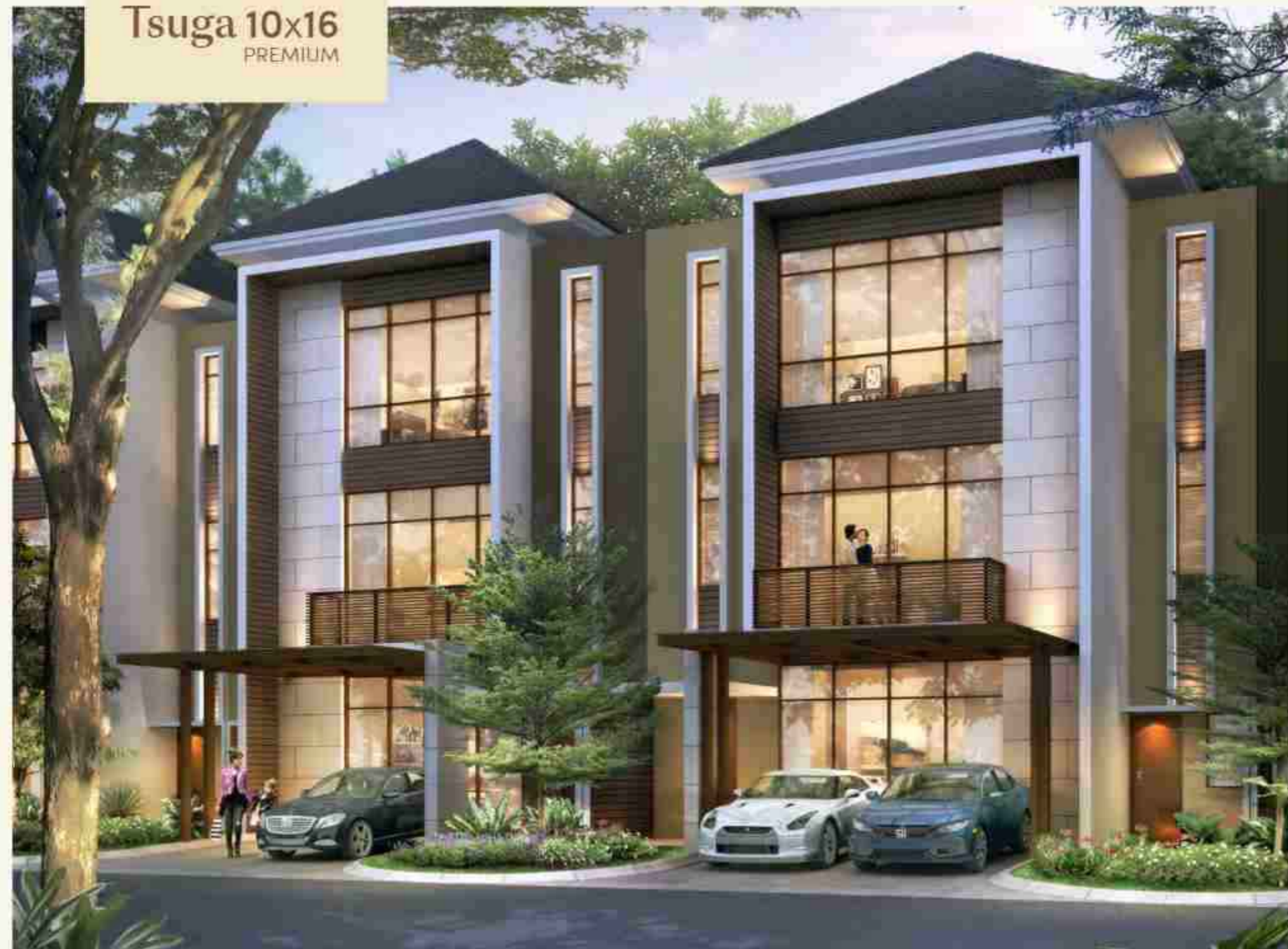
Tsuga 10x16 PREMIUM

Disarankan untuk memeriksa spesifikasi produk dan kondisi pada masa pengiriman. Untuk pengembangan, maka spesifikasi dan desain dapat berubah tanpa pemberitahuan terlebih dahulu dan perusahaan tidak akan bertanggung jawab atas kesalahan / data yang ditunjukkan banyak merupakan contoh dan bukan merupakan bagian dari perjanjian jual beli.